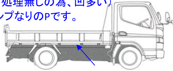
ボディ裏錆浮き有